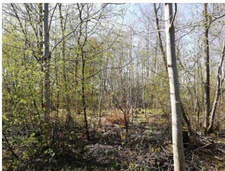
Foto 5 Vaade kinnistul kasvavatele puudele

Detailplaneeringu ala moodustatud teemaa ja elamumaade hoonetus aladele on teostatud Arbomare OÜ poolt „Jaanisalu kinnistu osaline haljastuse hinnang“, mille tulemusel antud alal kasvab põhiliselt harilik toomingas, hall lepp, harilik pihlakas, harilik saar, kask ning harilik haab. Ühtegi väga väärtuslikku ja kindlasti säilitamist väärt puud hinnatud puude seast ei leitud. Metsale iseloomulikult on Jaanisalu kinnistul kuivanud, ümber kukkunud, murdunud puud ja võsa. Kõige jämedam puu on 29cm läbimõõduga kuldkaask. Enamus puud on 10 - 20cm läbimõõduga noored puud. Säilitada tasub noori terveid puud, millel on olnud ruumi kasvada ühtlase võraga sirgeks puuks.